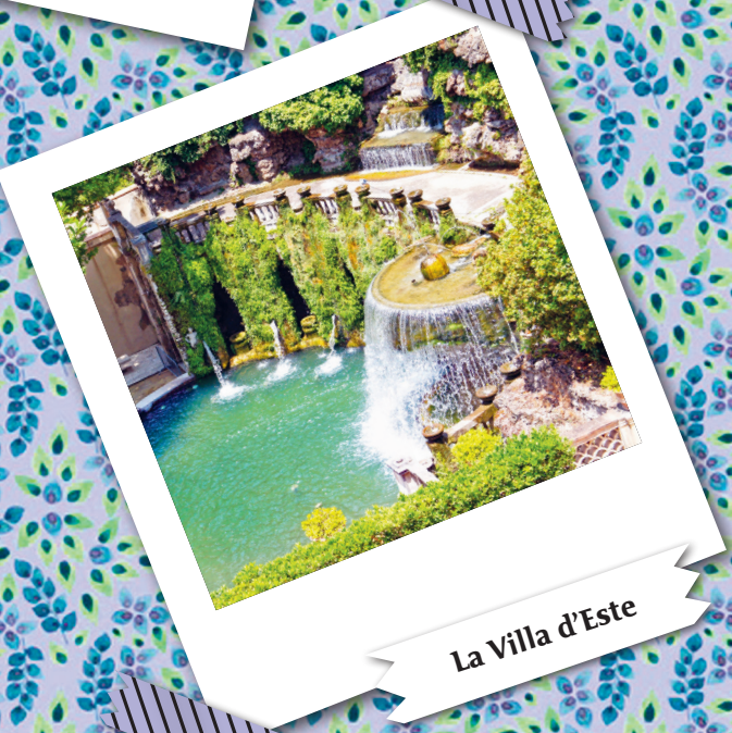
La Villa d'Este